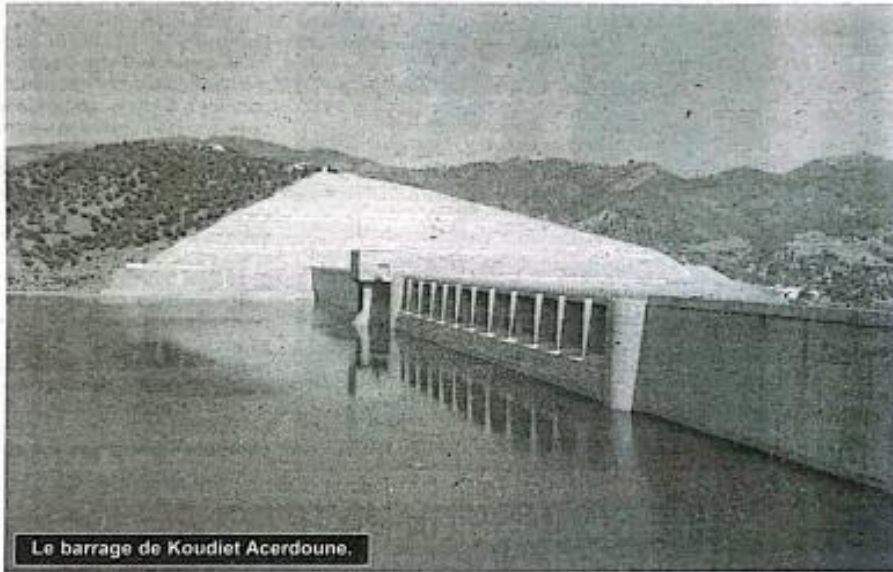
Le barrage de Koudiet Acerdoune.

Une présentation en règle sur la situation a permis au ministre des Ressources en eau de faire plus ample connaissance avec le secteur dont il préside désormais les destinées depuis quelques jours. Concernant les trois barrages, par exemple, il a appris avec satisfaction que les dernières pluies ont porté leurs niveaux à 136 millions de m3 pour le barrage de Maïn (Koudiet Acerdoune, premier point de ce déplacement), à 75 millions pour Tilezdit et, enfin, à 9,6 millions de mètres cubes pour Oued Lakhel. Pour le stockage, la wilaya dispose d'un système qui se compose de 750 réservoirs allant de 500 à 10 000m3. De là, Lounès Bouzegza s'est rendu à Zbarbar, une commune voisine, où il a procédé à la pose de la première d'un projet de forage pour la dite commune. Elle bénéficie de trois forages dans le cadre du programme présidentiel sur ce type d'ouvrages. Ces trois forages, d'une profondeur pouvant dépasser 1 000 m, selon l'étude géophysique réalisée, sont conçus pour enrayer la crise de l'eau qui sévit dans cette zone aride. Vers 10 h, direction Saharidj, à l'est de la wilaya. Ce qui a retenu l'attention du nouveau patron du secteur, séance tenante, c'est le raccordement de la source Aberkane au réservoir de 5 000 m3. L'apport de cette source est estimé à 6 000 m3. Au barrage de Tilezdit, à moitié plein, il a été